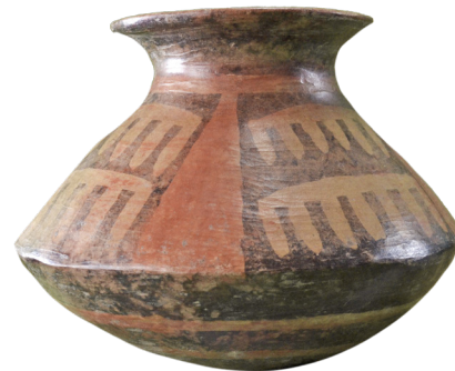
5. Olla lenticular