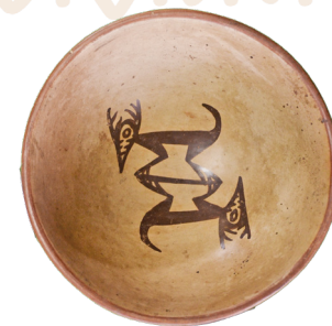
9. Plato cerámico con dos venados