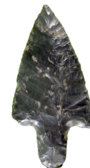
11. Cuchilla con punta fabricada en obsidiana