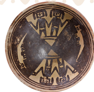
8. Plato cerámico con personas y animales