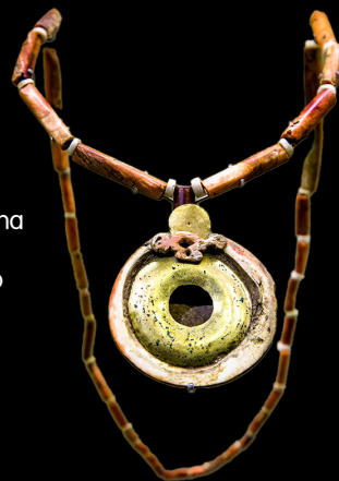
18. Collar con piezas en concha y elemento central en oro