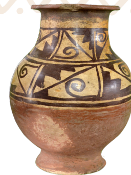
7. Ânfora con escaleras y espirales