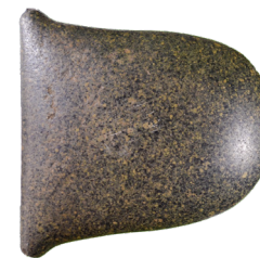
10. Piedra tallada parte de un hacha