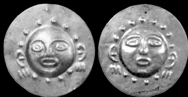
17. Pendientes de plata con rostros humanos repujados