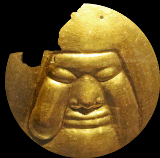
13. Pendientes elaborados en oro

Puedes conocer estas piezas visitando el Museo del Oro (Pasto y Bogotá).