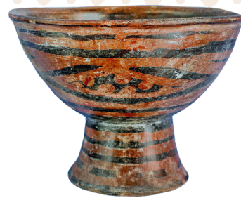
2. Copa con figuras geométricas