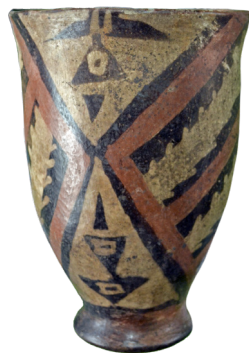
4. Vaso con base circular