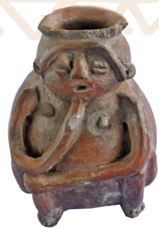
1. Recipiente con figura humana femenina