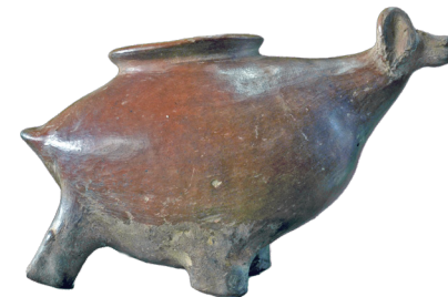
12. Recipiente con forma de un mamífero

Esta cerámica es especialmente admirada por sus gráficos que incluyen figuras geométricas, humanas y animales. Estos elementos reflejan la manera en que los PASTOS preservaban y transmitían su conocimiento.