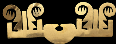
15. Nariguera elaborada en oro