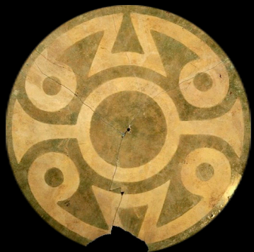
16. Disco giratorio martillado en tumbaga con dorado por oxidación