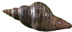
3. Instrumento musical en forma de concha marina