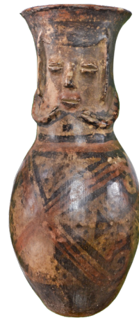
6. Ânfora con rostro humano