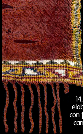
14. Textil elaborado con fibra de camélido